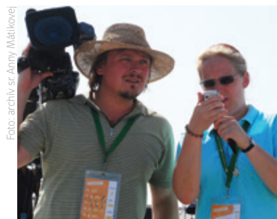
Svetové stretnutie mládeže Madrid 2011

Keď v roku 1915 vznikla naša rehoľa, pre naše sestry boli prostriedkami k hlásaniu evanjelia knihy, noviny a časopisy, čiže tlačenej médiá. Postupne sa k nim pridali rozhlas, audionahrávky, film a televízia. V súčasnosti sa k zoznamu pripája internet a najrozmanitejšie digitálne médiá. Každodenná skúsenosť nás presvedča o tom, že médiá v súčasnej digitálnej ére sú skôr prostredím, v ktorom žijeme, než prostriedkami, s ktorými narábame. Naším poslaním je žiť Bohu zasvätený život a pôsobiť v prostredí komunikácie, a práve toto prostredie s Božou milosťou posväcovať.